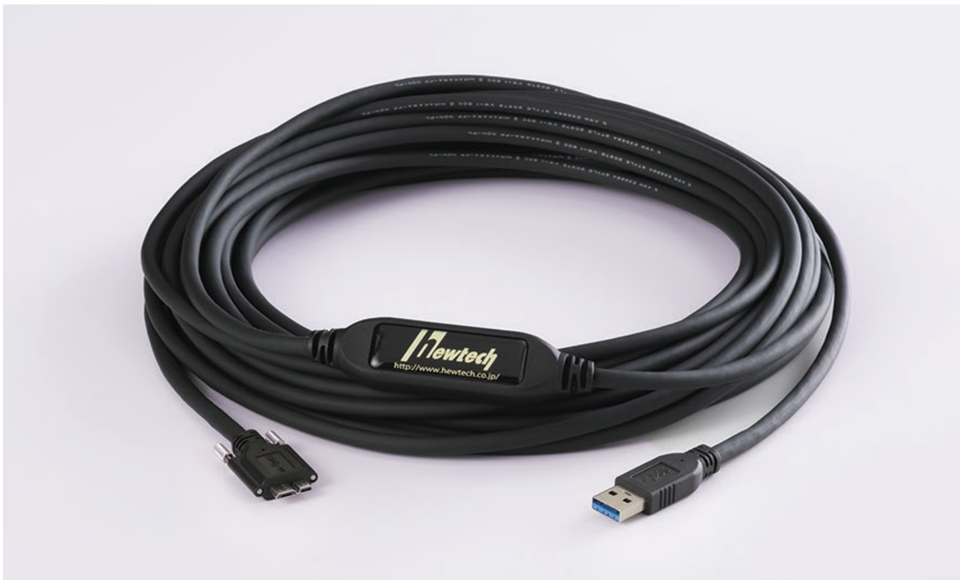
完成品例 : StandardA to MicroB(With Screw)

USB3Visionケーブルの中長距離伝送用として、ACC (Active Copper Cable) 製品をリリース中です。 コネクタは、スタンダードAタイプとType-B/MicroB (Screw有と無しの両方に対応) の組み合わせが可能です。 ケーブルも固定用/高摺動用の選択により、さまざま場面でご利用になれます。