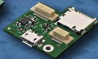
アダプターボード #1