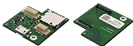
アダプターボード#1