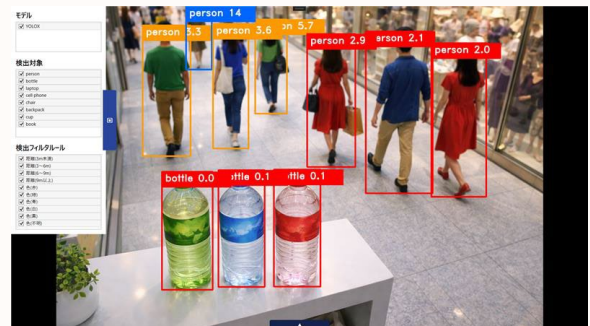
※画像は開発中のものです。

当社ではモデルの選定作業から、お客様独自のモデルの学習まで含めて、検出条件の柔軟な設計が可能です。