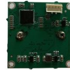
Quantum Efficiency - Color Sensor